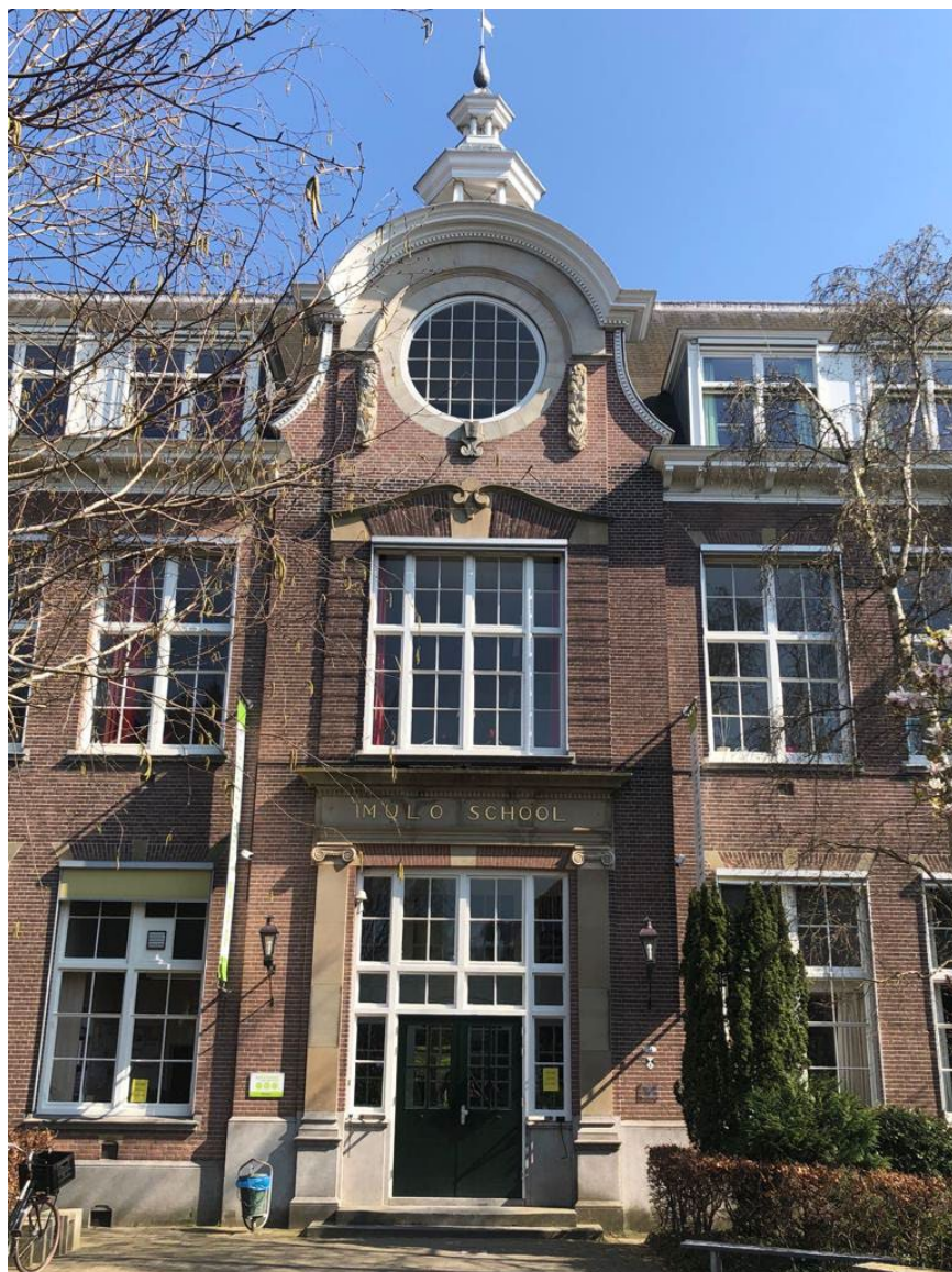
Ons schoolgebouw aan de Vijverweg 31 in Bloemendaal

Op onze site staat alle informatie over onze school: missie, visie en pedagogisch concept, de laatste nieuwtjes en heel veel praktische informatie (bereikbaarheid, financiën, aanmelden, et cetera). Ook is er een aparte rubriek “voor groep 8”.